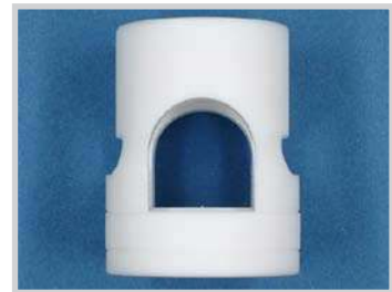
Fijación para sensor M30 - tubo 3/4", PTFE