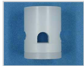
Fijación para sensor M18 - tubo D 5.0, Nylon