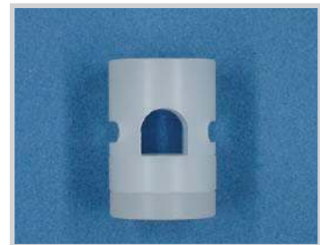
Fijación para sensor M18 - tubo D.6.5, Nylon