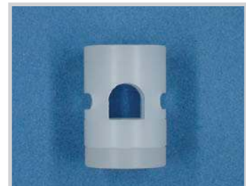
Fijación para sensor M18 - tubo D.6.5, Nylon