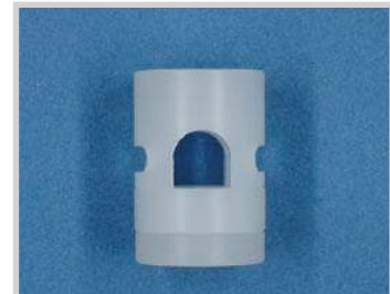
Halter für Sensor M18 - D.6.5 Rohr, Nylon