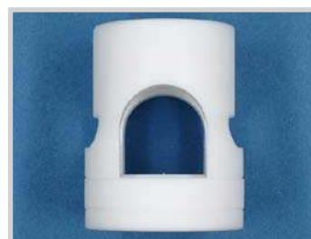
Supporto per sensori M30 - tubo 3/4", PTFE