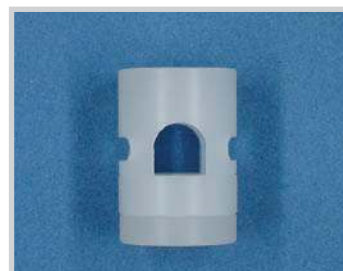
Supporto per sensori M18 - tubo D.6.5, Nylon