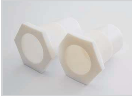
Fig.: Frontali di protezione M30 / M32 PTFE