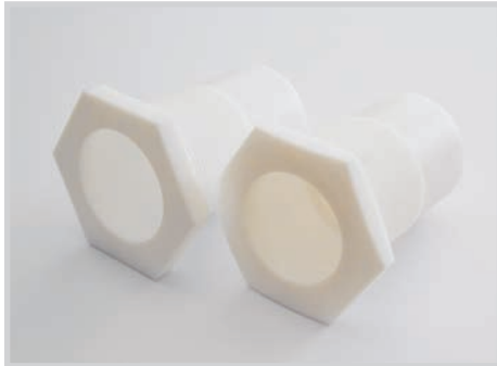
Fig.: Frontali di protezione M30 / M32 PTFE