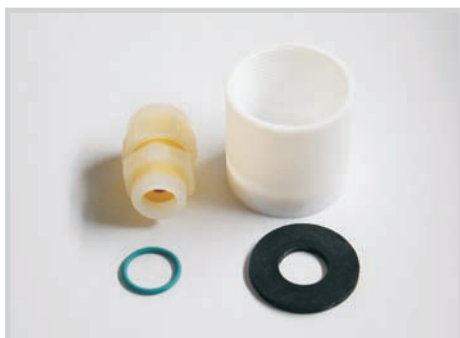
Kit d'étanchéité M18 Code Art. 196305